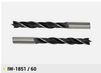
► IW-1851 / 60

Irwin - Lenox Twill / Brocas 3 Puntas para Madera