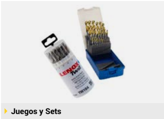
▶ Juegos y Sets