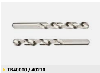
► TB40000 / 40210